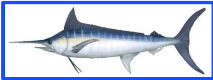
Ilustración: Alexis Rivera Miura y Daniel Irizarri Oquendo.

Requiere permiso especies altamente migratoria (HMS)